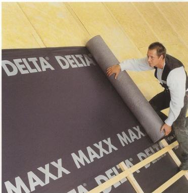
DELTA®-MAXX - najczęściej sprzedawana w Niemczech folia wstępnego krycia do dachów skośnych.